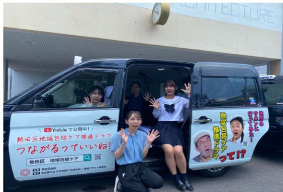
つばめタクシー様協働ラッピングタクシー