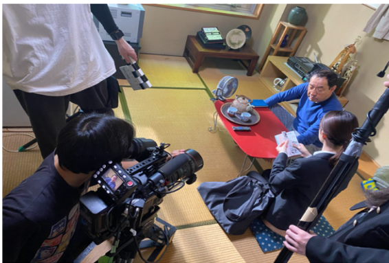
ドラマ撮影の様子